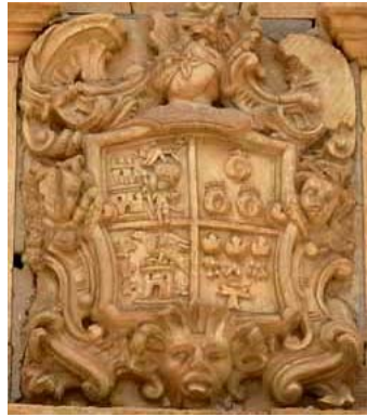
Escudo de la Casona de Milmarcos