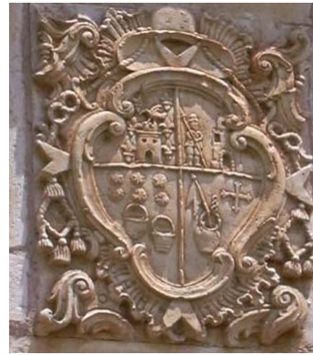
Escudo de la Ermita de N.S. de los Dolores, con timbre eclesiástico.