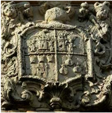
Escudo de la Casona de Hinojosa